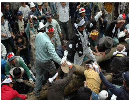
(鉤引き祭り②イメージ)