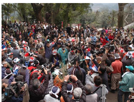
(鉤引き祭り①イメージ)