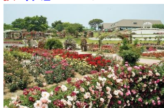
鹿屋市「かのやバラ園：イメージ」 かのや市「吾平山上陵：イメージ」