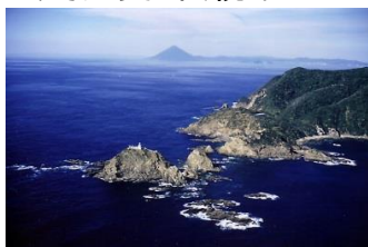
本土最南端地「佐多岬」

どうぞ歴史と伝統あるかのや市：高隈かぎ引き祭りを体験・体感しにお出かけ下さい！！